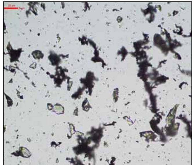
Kühlschmierstoffprobe aus laufender Großserienproduktion